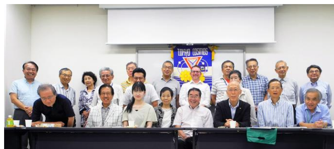
【8月15日に行われた第5回仮例会での集合写真】