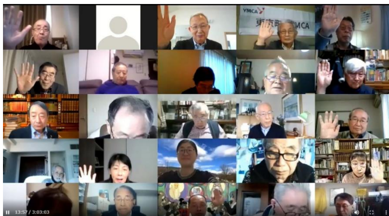
【笑顔で議案を承認する第 3 回評議会出席者】