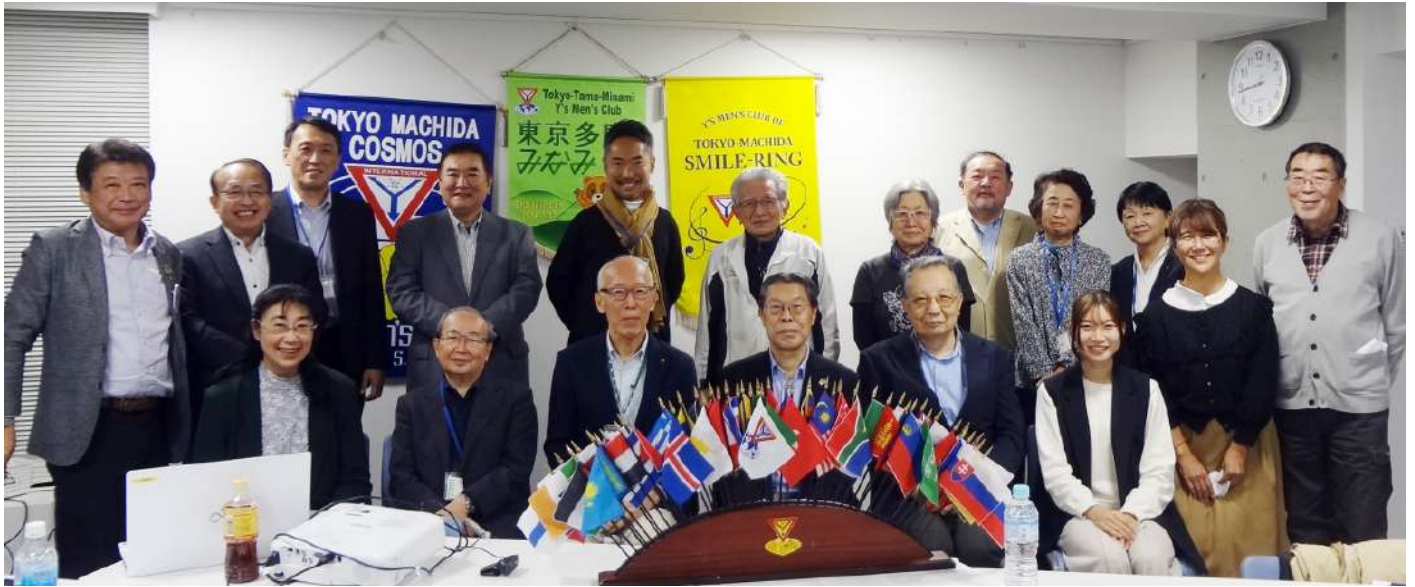
10月19日（水）玉川学園コミュニティセンター 3クラブ合同例会記念写真