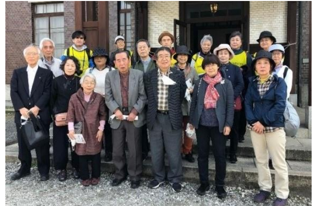
旧石川組製糸西洋館の前で参加者一同

池袋から西武池袋線に乗り、稲荷山公園駅で降り、参加者の皆さんとここからスタートしました。霞川沿いの桜並木を歩き、旧石川製糸西洋館、武蔵豊岡教会、旧黒須銀行を訪れ、かねてから訪ねてみたいと思っていた明治・大正期の素晴らしい歴史的建造物を見学することができました。