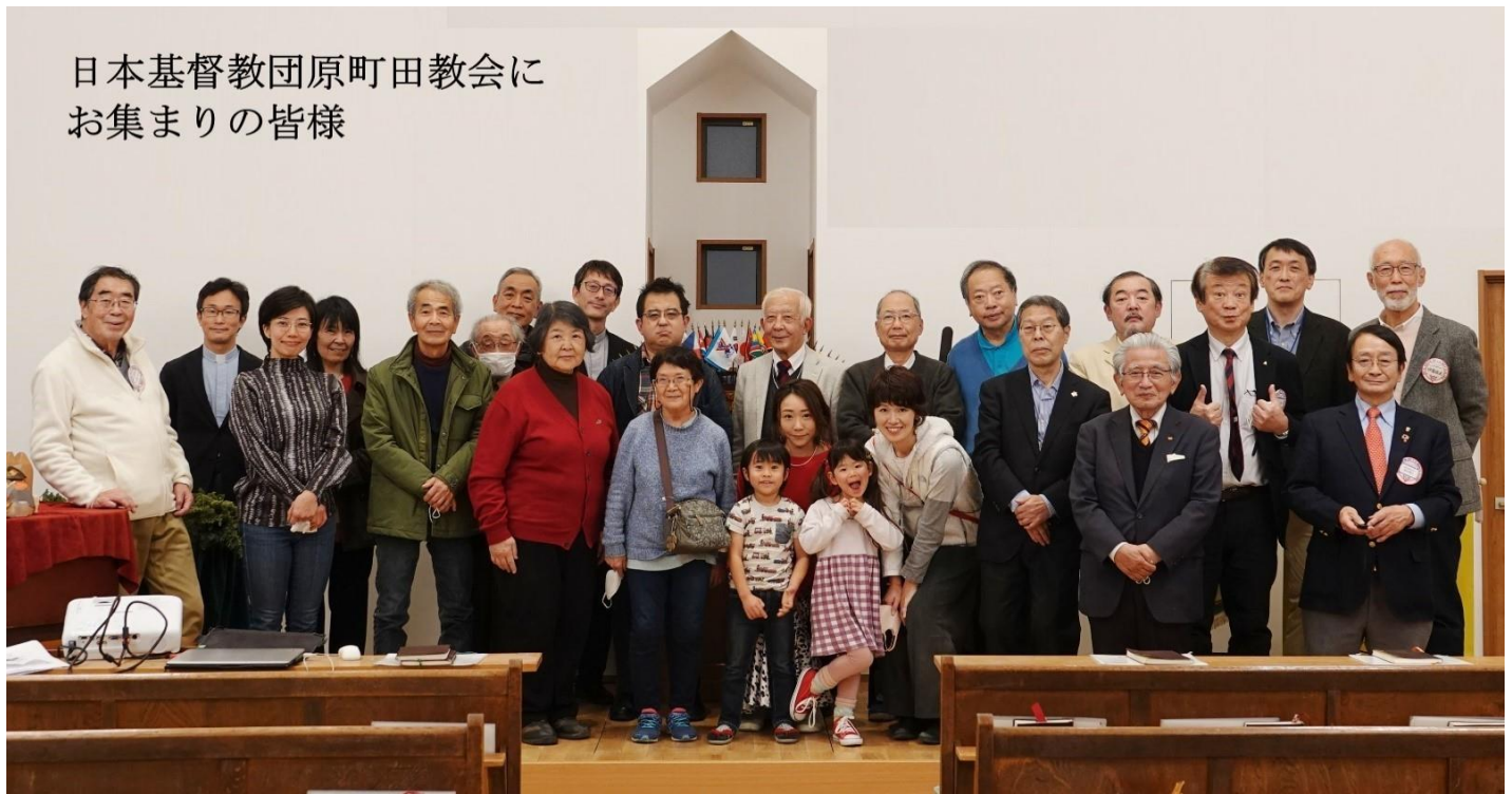
日本基督教団原町田教会にお集まりの皆様

次いで、12月誕生日を迎えた方々へのハッピーバースデー、クリスマス・プレゼント交換、各クラブのアピールや東新部の主査方からの報告等がありました。参加者は36名(そのうちZoom参加者は4名)でした。